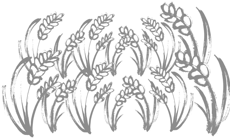
平成18年産 制度別検査実績数量表

られました。穂発芽等への影響は少なく作況指数「100」の平年並の作柄となりました。