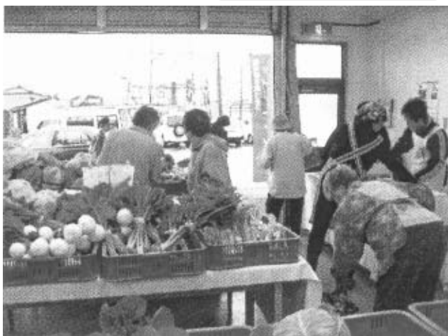
毎回50名~100名の方が来場