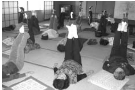
(運動で内臓脂肪を減らしましょう)